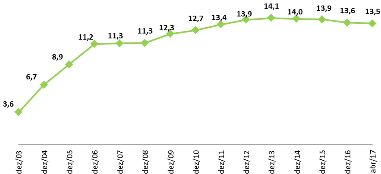
Gráfico - Evolução anual do número de famílias beneficiárias do PBF - Brasil, 2003 a 2017 (em milhões)