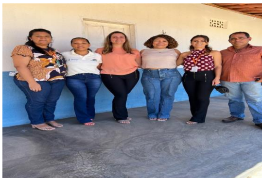
Município de Quiterianópolis