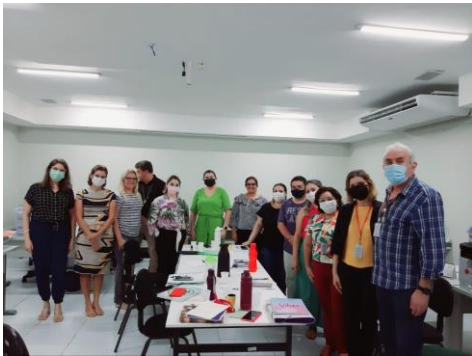
Município de Caucaia