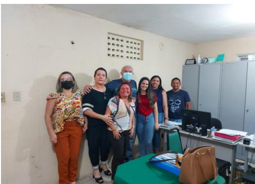
Município de Marco