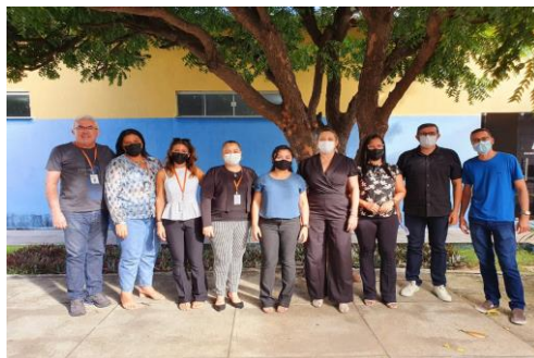
Município de Ipueiras