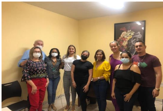
Município de Ibiapina