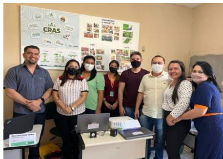
Município de Tauá