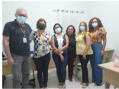
Município de Guaiuba