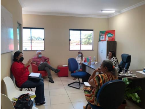
Município de Aracati