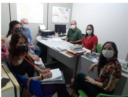
Município de Farias Brito