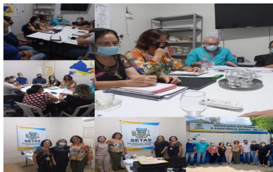
Município de Quixadá