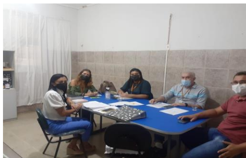
Município de Missão Velha