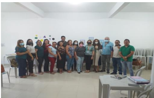
Município de Trairi