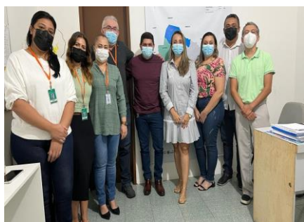
Município de Santa Quitéria