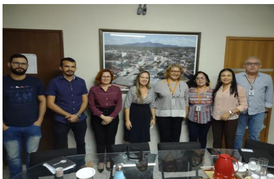
Município de Apuiaries