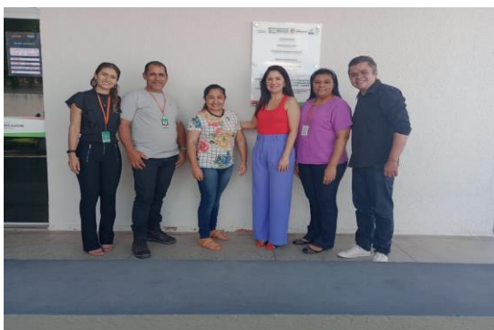
Município de Várzea Alegre