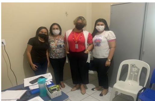
Município de Russas