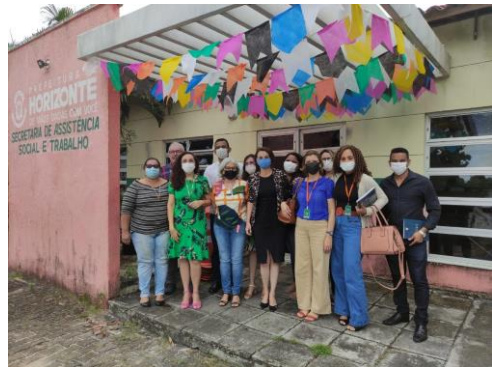
Município de Horizonte