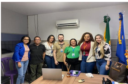
Município de Umari