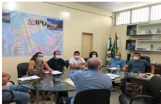
Município de Ipu