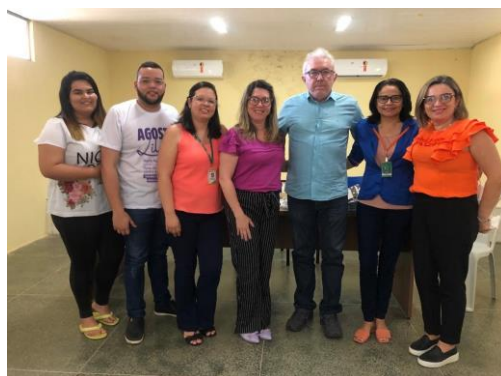
Município de Tianguá